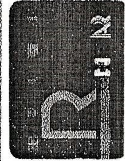
Figura la ELTRONIS